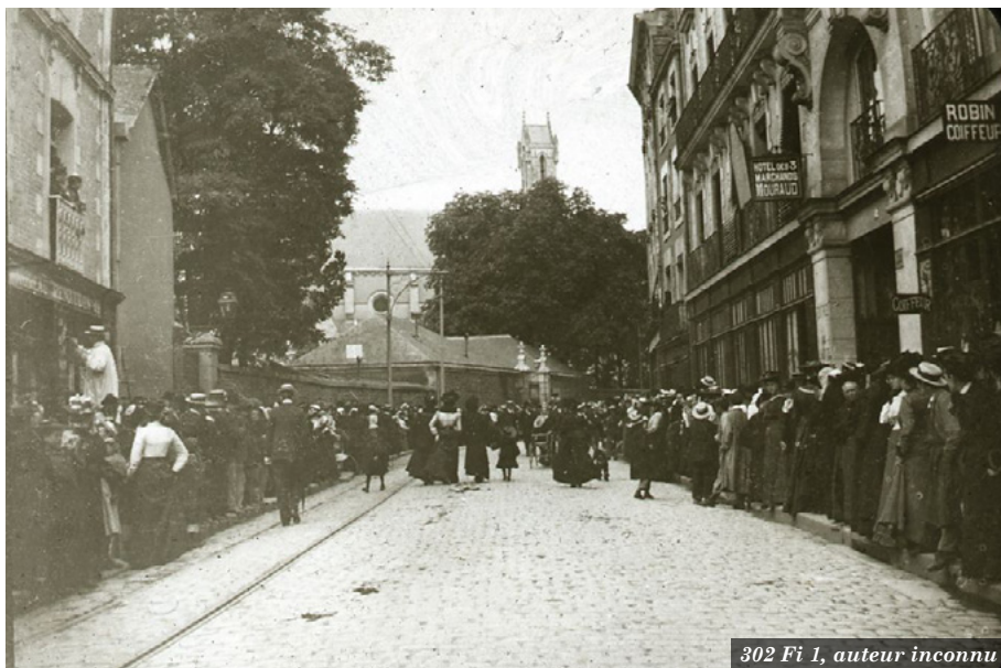
302 Fi 1, auteur inconnu

L'image ci-dessous provient de la numérisation d'un négatif sur plaque de verre (302 Fi 1) au gélatinobromure d'argent, procédé photographique de la fin du 19 e - début 20 e siècle. Elle présente une manifestation d'Eudistes (du nom de la congrégation fondatrice de l'école Saint-Martin de Rennes) qui se déroule rue d'Antrain en 1903. On peut apercevoir par hasard la présence de l'enseigne "Hôtel des 3 Marchands Mouraud".