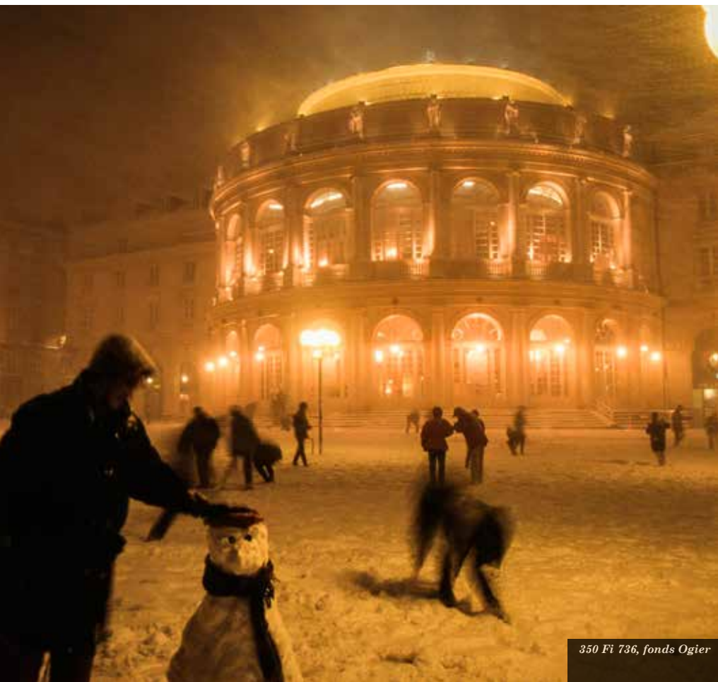
350 Fi 736, fonds Ogier

Ce guide propose de présenter les fonds d'archives privées conservés aux Archives de Rennes, sous l'angle de leur contenu et de leurs modes d'entrée aux Archives. Il offre également des pistes pour des particuliers, des associations ou des entreprises qui souhaiteraient confier leurs documents à la Ville de Rennes afin d'enrichir son patrimoine tout en laissant une trace à la postérité.