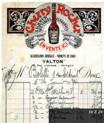
10 Z 39

La mission première d'un service d'archives est de permettre la conservation à long terme des documents, dans les meilleures conditions matérielles, afin que soient assurées leur sauvegarde et leur pérennité. À cet effet, les services publics d'archives disposent de moyens de conservation, de conditionnement et de reproduction qui permettent de protéger les documents originaux. Car le risque de dégradation matérielle des documents est élevé. Supports fragiles, le papier, les documents photographiques ou audiovisuels, craignent la lumière, la chaleur et l'humidité. Dans de mauvaises conditions de conservation, les documents peuvent subir des dégradations irréversibles !