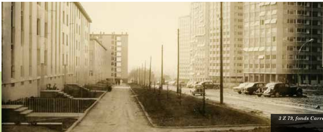
3 Z 79, fonds Carré

Archives départementales (cas d'une entreprise développant son marché sur l'Ille-et-Vilaine), voire vers les Archives nationales, si le fonds présente un intérêt d'ordre national (cas d'un ingénieur et pilote d'essai vivant à Rennes, dont les travaux ont fait progresser la technique de l'aviation durant la Première Guerre mondiale).