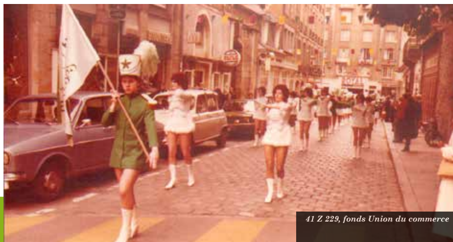
41 Z 229, fonds Union du commerce